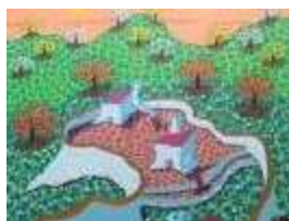
Miguel Guerra Zamora

Que estas imágenes coloridas y amables nos os engañen en cuanto a su significado. Las imágenes significantes han ido surgiendo de forma continuada y con fluidez. [ver+]