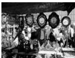
Paseo fotográfico por El Rastro

La exposición consta de 30 cuadros pintados al óleo que reivindican a la mujer sin tabús, con autoestima y segura de sí misma. [ver+]